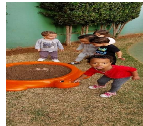
Atividade 6: Conhecer se